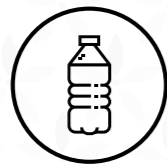
Pots i bòtils de plàstic