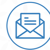
Fullet i sobres