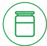
Pots de vidre