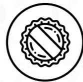
Taps de metall