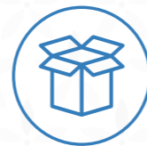
Capses de cartó ben plegades