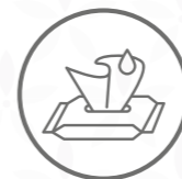
Tovallolletes, gases, tiretes