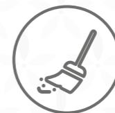
Pols d'agranar, cendra, pèl