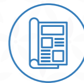
Diaris i revistes