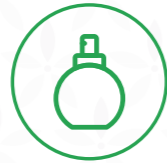
Bòtils de parfum