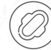
Tèxtil sanitari (bolquers, compreses, tampons)

Assegurau-vos que els residus que voleu tirar no es puguin reciclar. Posau-los dins una bossa ben fermada.