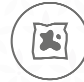
Paper i cartó molt bruts