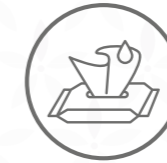
Tovallletes, gases, tiretes