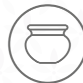
Cerámica y porcelana (objetos pequeños)