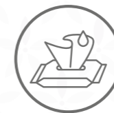
Toallitas, gasas, tirites