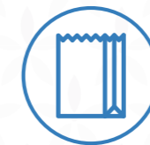
Bolsas de papel

Vaciar los envases de líquidos y materia orgánica. Deposite los residuos bien comprimidos sin bolsa dentro de los contenedores amarillos que encontrará en el área de aportación cerrada.