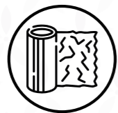
Papel de aluminio