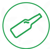
Botellas de vidrio