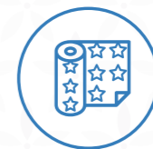
Papel de envolver