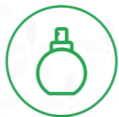
Botellas de perfume