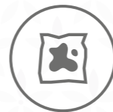
Papel y cartón muy sucios