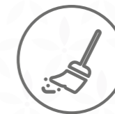
Polvo de barrer, ceniza, pelo